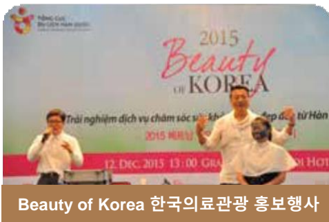
Beauty of Korea 한국의료관광 홍보행사