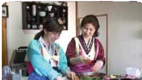
한국 의료관광 홍보 방송 제작/방영