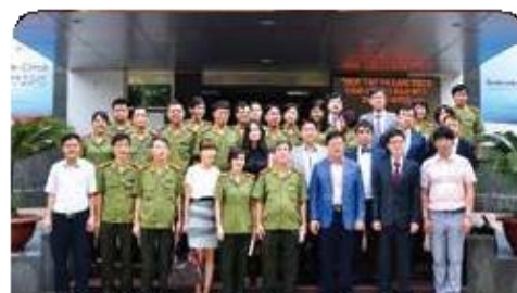
베트남 공안부 병원 사업 협력