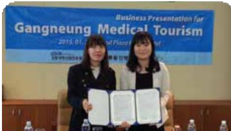
강릉과학 산업 진흥원 업무 협약식