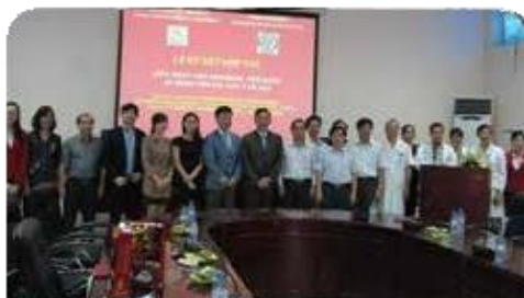
연세대 세브란스 병원 - 하노이 의과대학 MOU