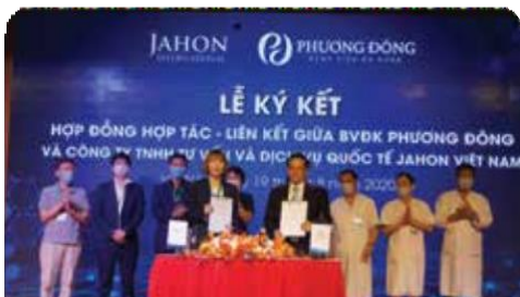
프엉동 종합병원 검진/국제진료센터 계약체결