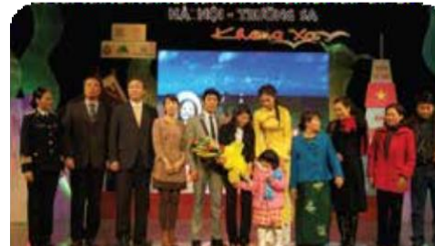
나눔 의료 Love Bridge 생방송