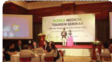
한국의료관광 홍보 설명회