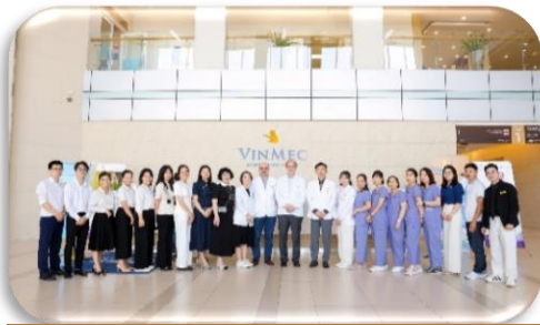
Vinmec View Dental - 한국 치과 협력 진료 컨설팅