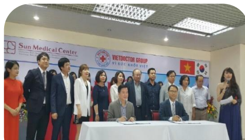
대전 선병원 한국의료시스템 베트남 수출