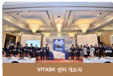
VITASK 센터 개소식

VITASK센터 개소식 기획 / 대행 (한국/베트남 산업통상자원부 장관 참석)