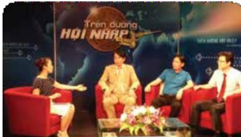
건강 의학 TV 프로그램 제작