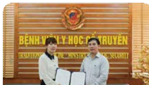
MOU between Jahon International and Traditional Medicine Hospital - Ministry